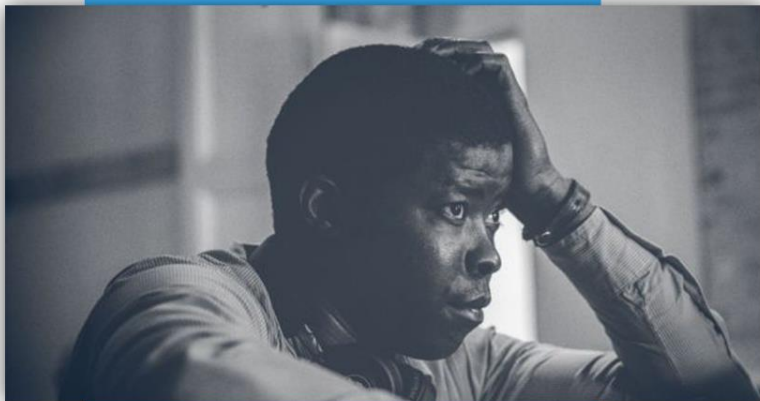
Disparu depuis le 14 mars 2018

Par-dessus tout, le programme de bourse d'étude, qui s'inscrit dans une perspective de lutte pour la liberté de la presse et la liberté d'expression en Haïti ; vise à favoriser le droit à l'information et la liberté d'opinion et d'expression pour tous-te-s. Lequel programme entend aussi contribuer à l'épanouissement et à plus de professionnalisation de la presse haïtienne. Car plus les journalistes sont bien formés, plus ils feront un travail de qualité ; et plus la population sera mieux informée, plus avertie et plus apte à prendre des décisions éclairées pour leur avenir de peuple. Donc cela dit, le programme de bourse d'étude : Jean Léopold Dominique & Vladjimir LEGAGNEUR aura non seulement de retombées éducationnelles non négligeables mais aussi des retombées socioprofessionnelles majeures, et contribuera, à sa façon, au processus de démocratisation de la société.